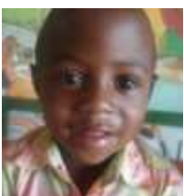
Baraka 4 anni